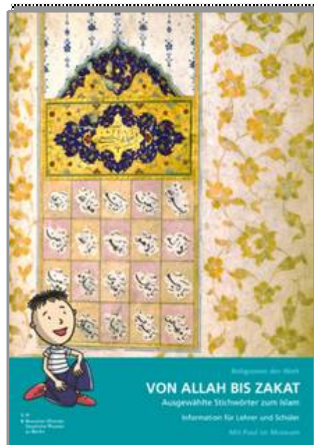
Ausgewählte Stichwörter zum Islam 24 Seiten, 4/4 farbig, DIN A4