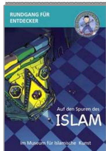
Rundgang für Entdecker Faltplan mit einem Rundgang durch das Museum für Islamische Kunst zum Thema Religion, 4/4 farbig, DIN A3